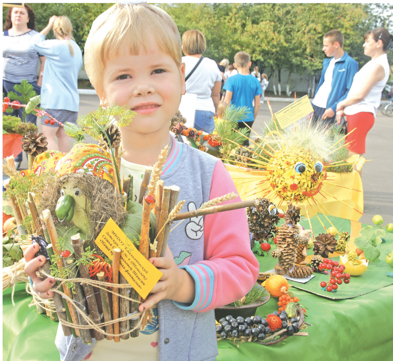
Главные гости мероприятия – наши дети!