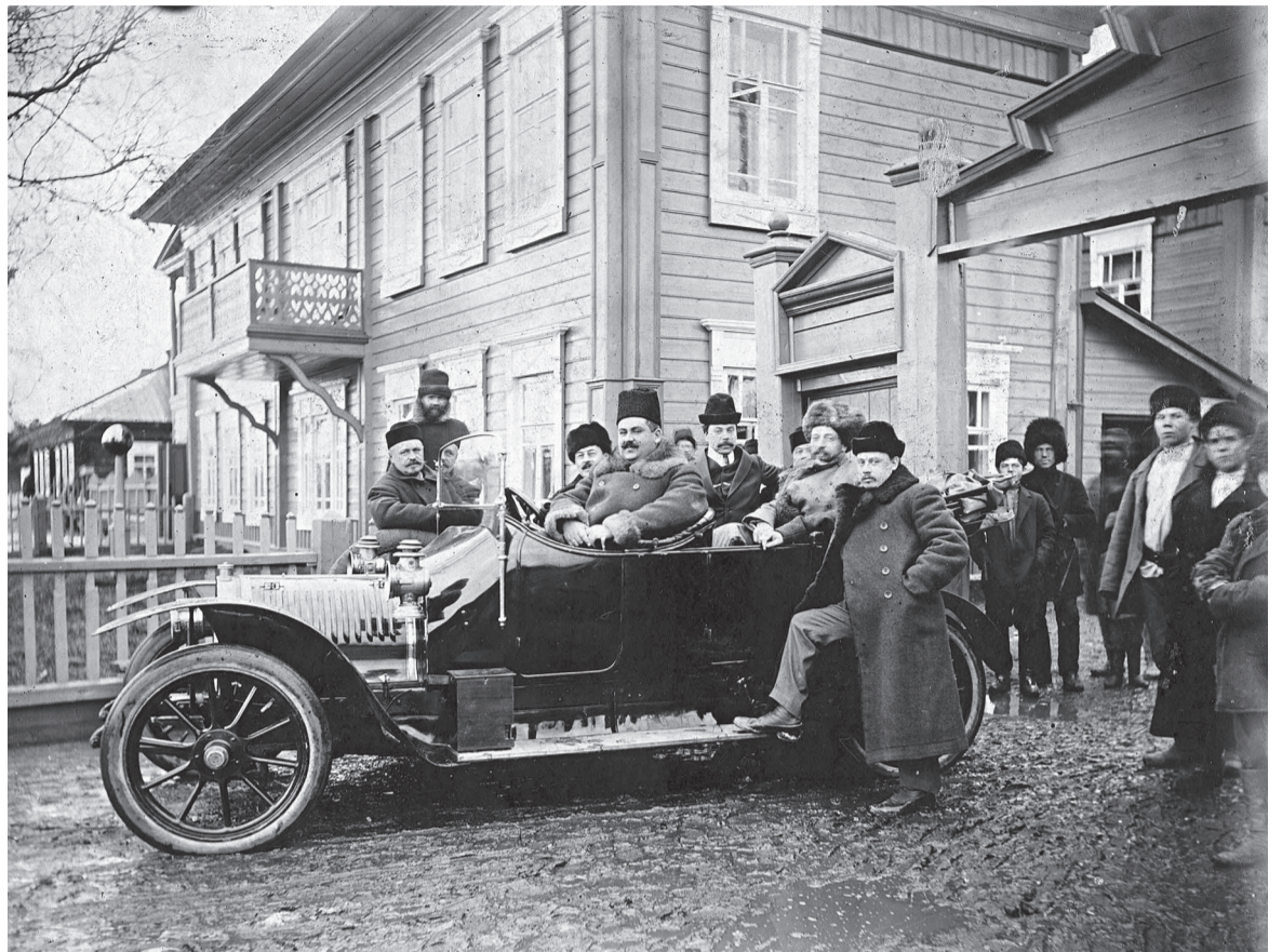
Первый автомобиль у конторы Знаменского стекольного завода

чувствующих», «сочувствующих», «соучастующих»: идеологически индексируемые имена писателей, мыслителей, деятелей культуры и искусства от Радищева и Пушкина до Горького и Демьяна Бедного.