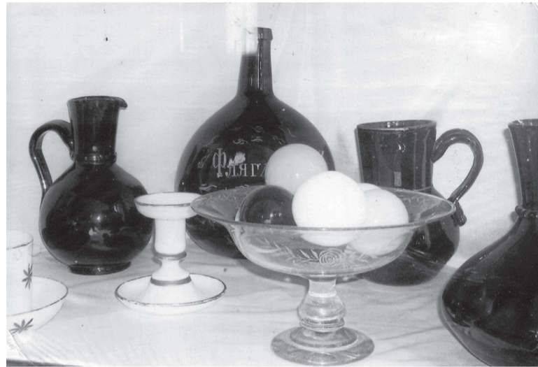
Продукция стекольного завода

Уполномоченные сотрудники органа исполнительной власти проводят экспертизу по правилам, установленным приказом Минэкономразвития РФ от 27 марта 2014 г. № 171.