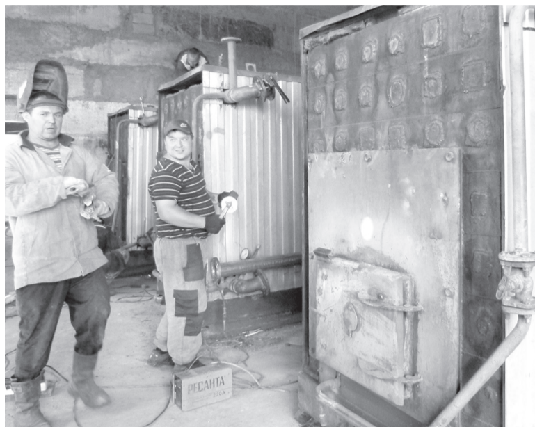
Работы на котельной ЦРБ

На базе ЕКК производится сборка циклонов, складываются трубы и железобетонные сборные лотки для текущих ремонтов тепловых сетей, которые применяются для защиты конструкции водопровода.