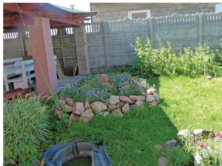
Двор семьи Рудиковых