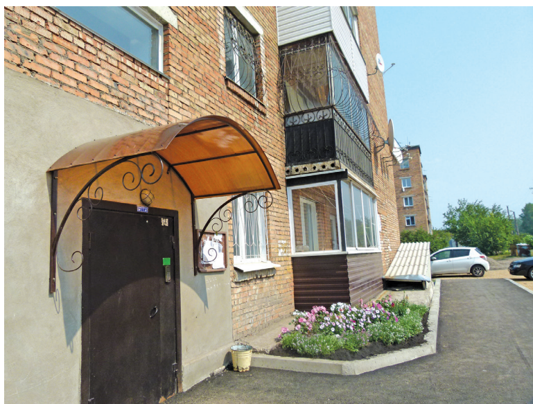
Установили новые подъездные козырьки

Наталья Семенова, специалист Администрации п. Емельяново