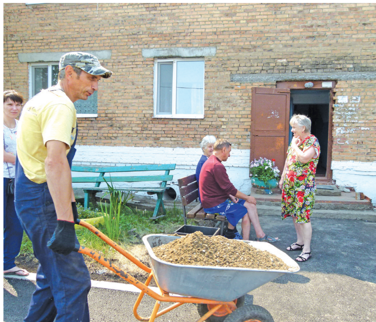
В процессе работы

В рамках реализации программы «Формирование комфортной городской (сельской) среды» на дворовых территориях, которые попали в нее в 2018 году, продолжают