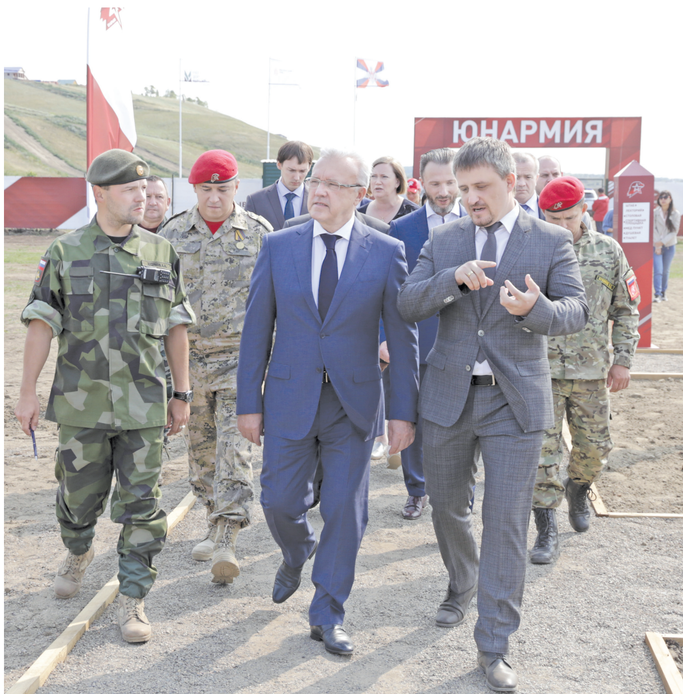
Александр Усс посетил лагерь юнармейцев