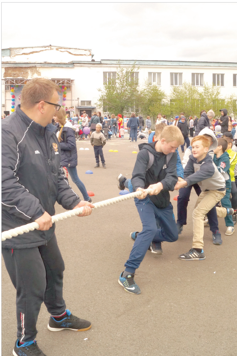
Ребяшня состязалась в перетягивании каната