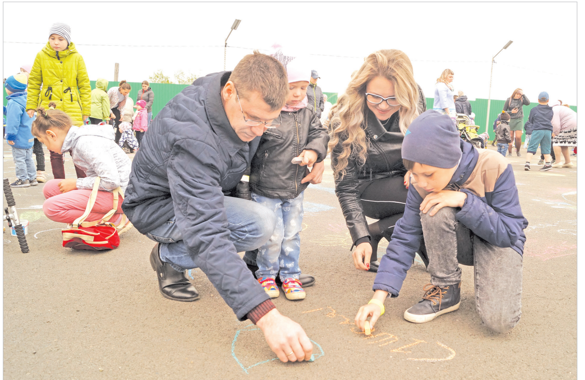
Рисовали целыми семьями