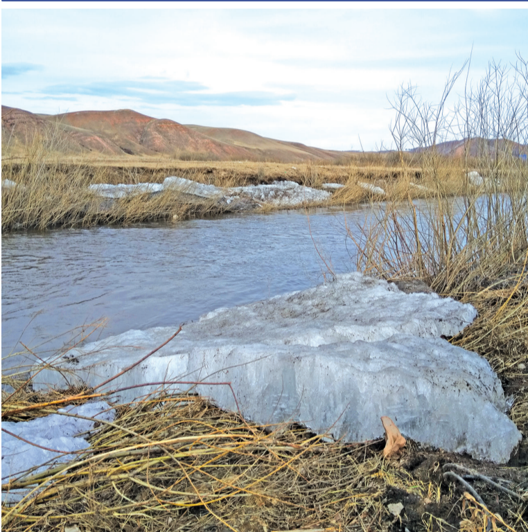
На прошлой неделе вскрылась река Кача. Из-за образовавшегося затора около моста, ледяные глыбы выкидывало на берег. Не повезло тальнику, растущему вдоль реки, его льдины изрядно поломали. д. Дрокино