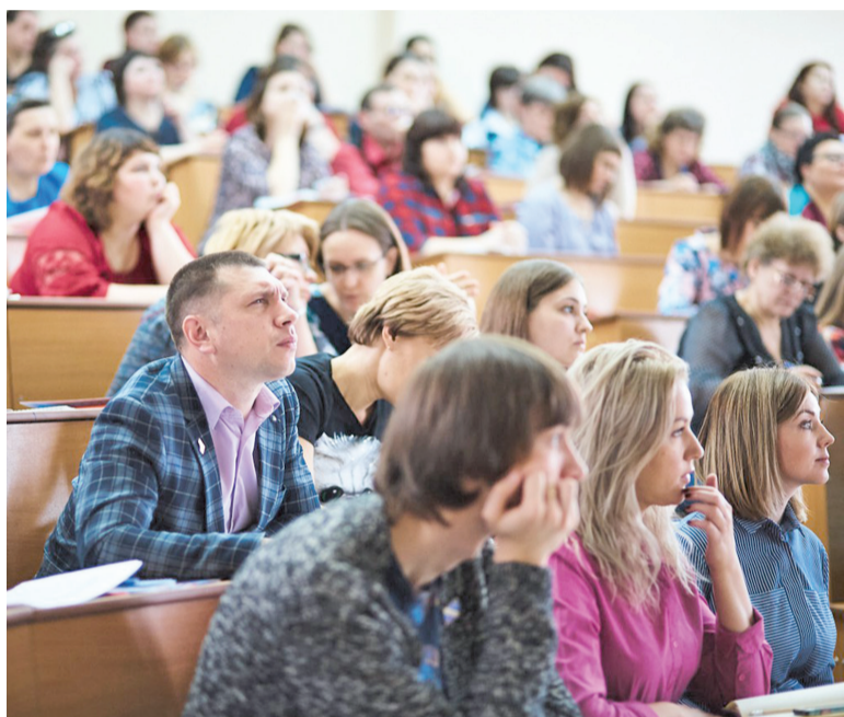
Емельяновцы на семинаре

Отдел спорта и молодежной политики