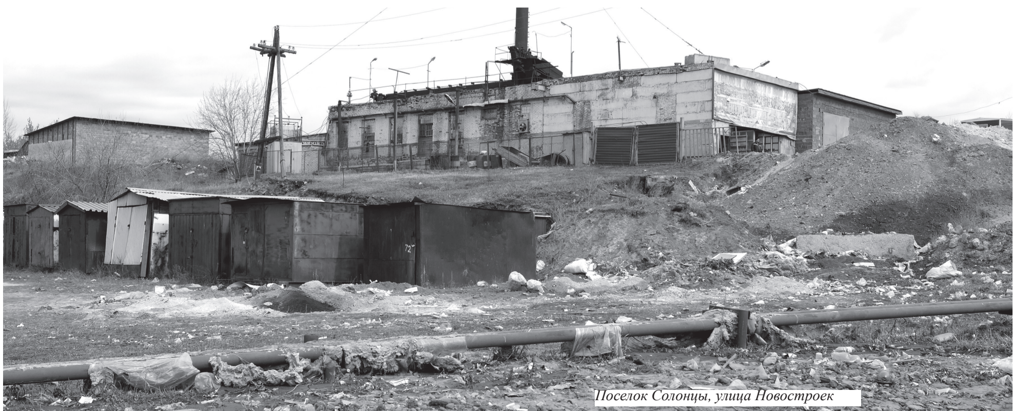
Поселок Солонцы, улица Новостроек