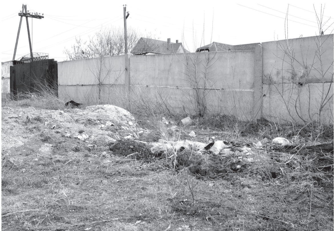
Поселок Солонцы, улица Северная