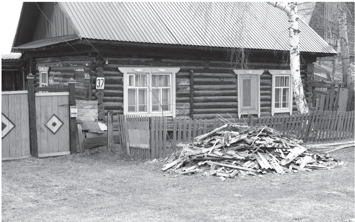
Поселок Памяти 13 Борцов улица Советская