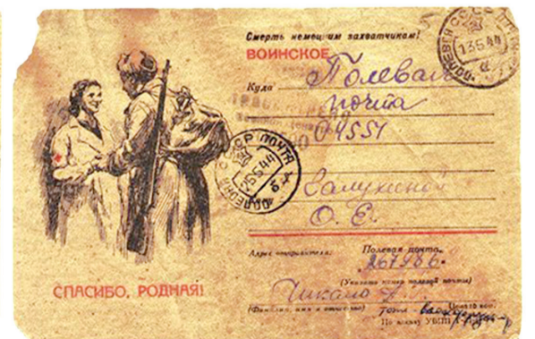
Односторонние почтовые карточки "ВОЙНСКОЕ", 1943 и 1944 годы.