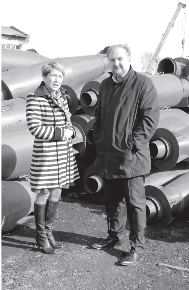
Специальное оборудование, улавливающее выходящую с отработанными газами золу. Уже закуплено