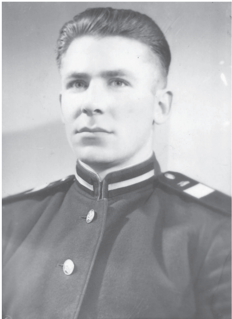
Перед демобилизацией. 1959 г