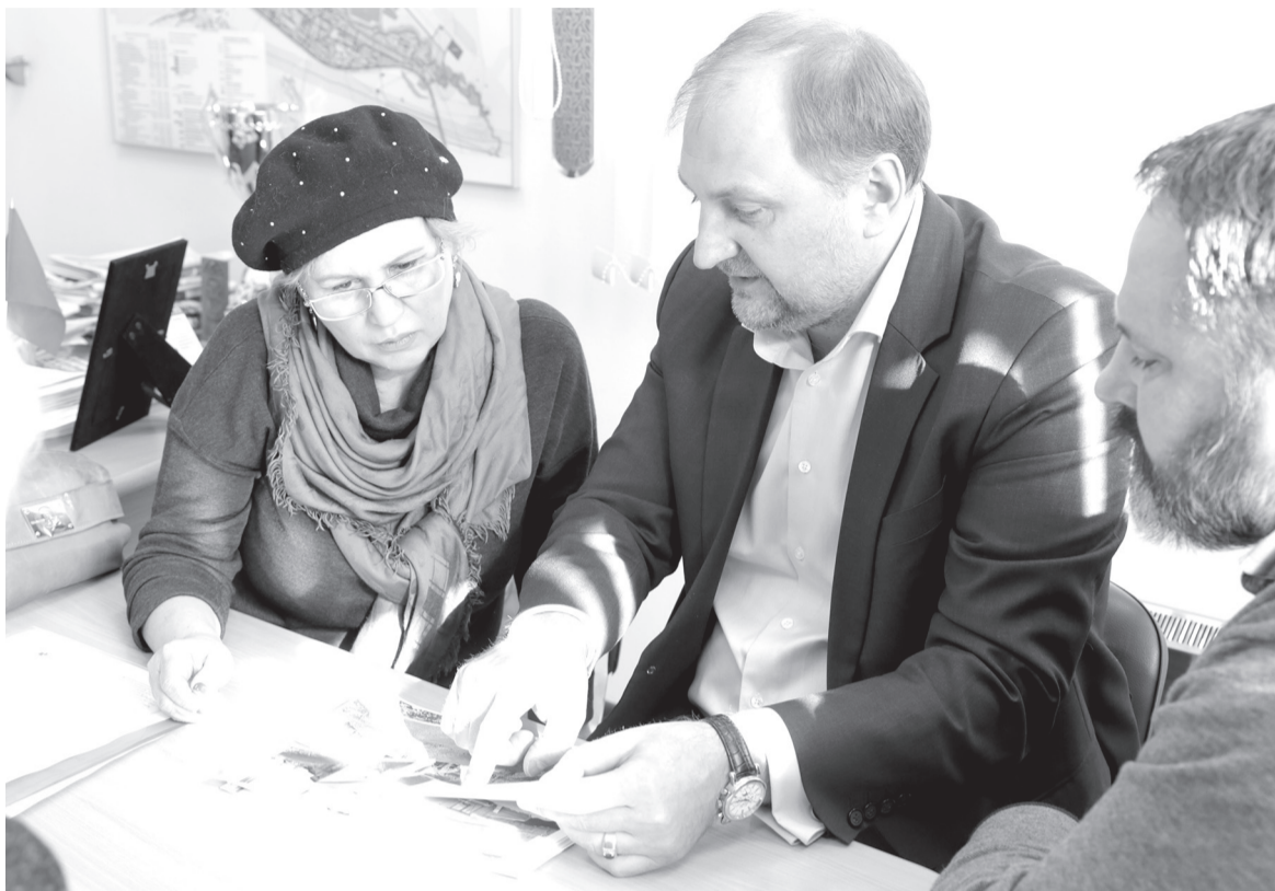
Следующий этап – проектирование и строительство котельной за границами поселения

- К главе поселка Емельяново мы приехали сегодня для того, чтобы посмотреть, что можно сделать именно по проблемам поселка Емельяново. Главное, что мы объединили в одну рабочую группу здесь в кабинете главы тех, кто спрашивал. И тех, кто отвечает на вопросы людей. Мы познакомимся с теми инициативными группами, которые готовы работать по проблемам поселения не точно – от случая к случаю, а в плановом рабочем порядке. Мы сегодня сняли вопрос по социальным торговым рядам. Принципиально вопрос решен.