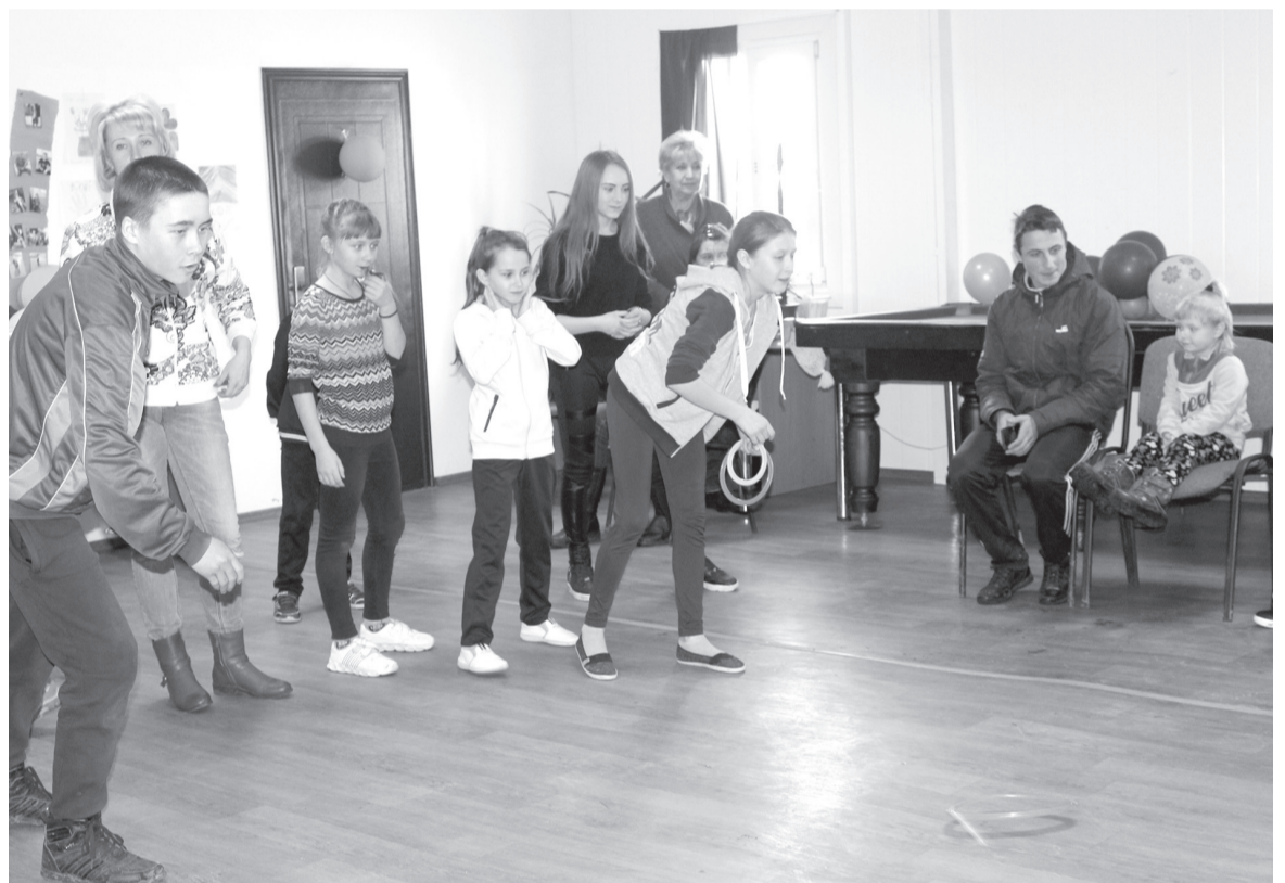
Конкурсы чередовались один за другим, но дети без устали погружались в атмосферу спортивного азарта