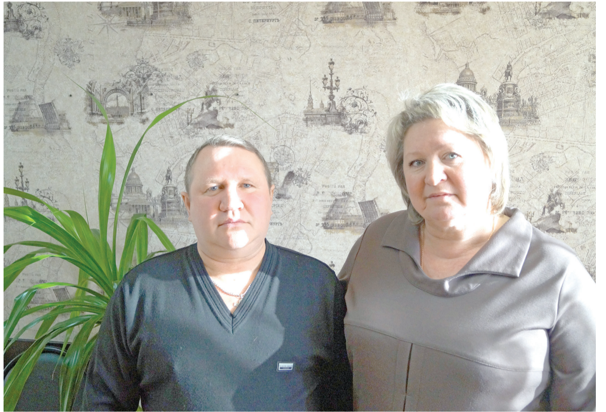
Студент техникума водного транспорта

- А моя жизнь в культуре началась ровно сорок лет назад. Началось с того, что мой крестный купил мне детскую гармонику. И я, не зная никакой нотной грамоты, никаких теоретических основ, на слух подобрал «Во поле березка стояла». Когда родители это услышали, они тут же пристроили меня в музыкальную школу. Потом я спел несколько раз по радио и меня сразу же пригласили в вокальный ансамбль «Радуга». Как окончил школу, поступил в техникум водного транспорта, где тоже не бросил художественную само-