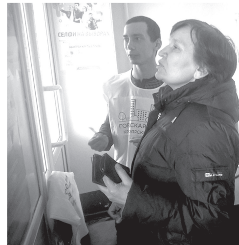
Жители Емельяново голосуют за проект