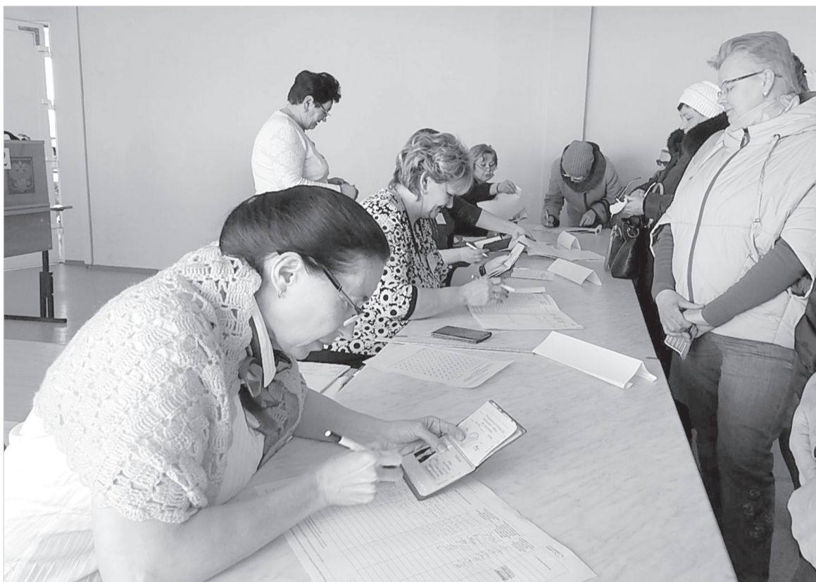
Граждане шли на избирательные участки с самого утра

Помимо наблюдателей от коммунистической партии и от кандидата Владимира Путина, также избирательные участки Емельяновского района посетили в качестве наблюдателей представители ОБСЕ – граждане Финляндии и США,