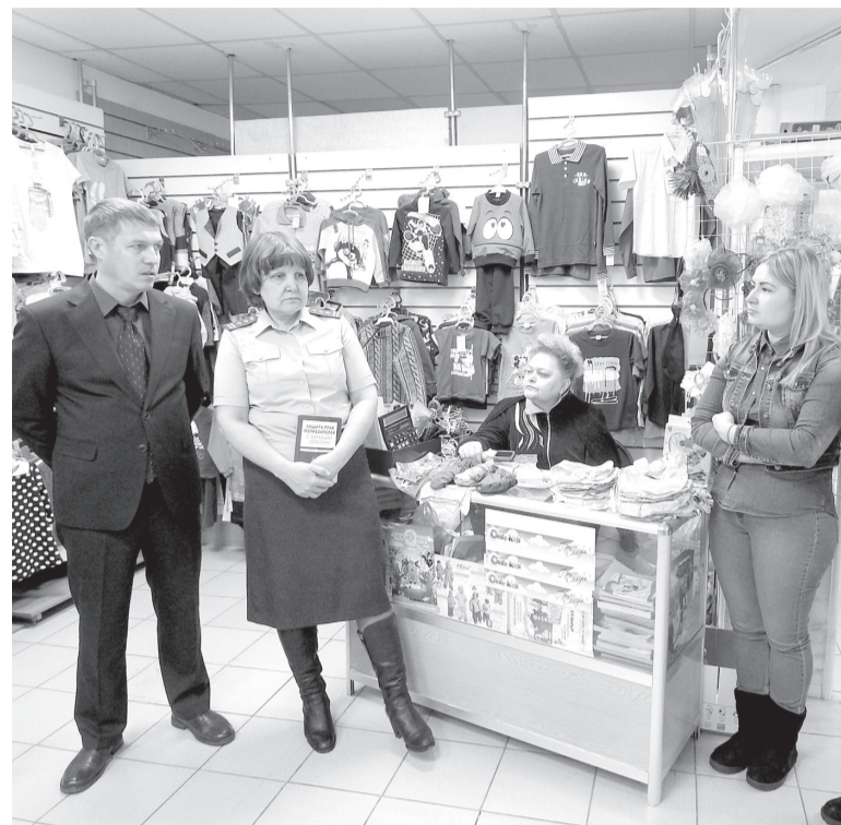
Представители Роспотребнадзора выезжают на встречи с предпринимателями и покупателями

Жители Красноярского края могут также безвозмездно получить консультации по всем спорным ситуациям, связанным с приобретением товаров и услуг, в том числе в сети интернет, и помощь в подготовке претензий и исковых заявлений в Роспотребнадзор Красноярского края и найти ответы на большинство вопросов на сайте Управления, где, в том числе, размещены образцы документов (заявление на возврат товара надлежащего