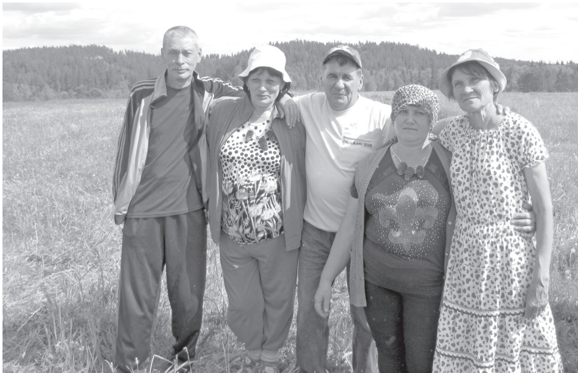
Встреча односельчан. На месте где стояла деревня Моховушка