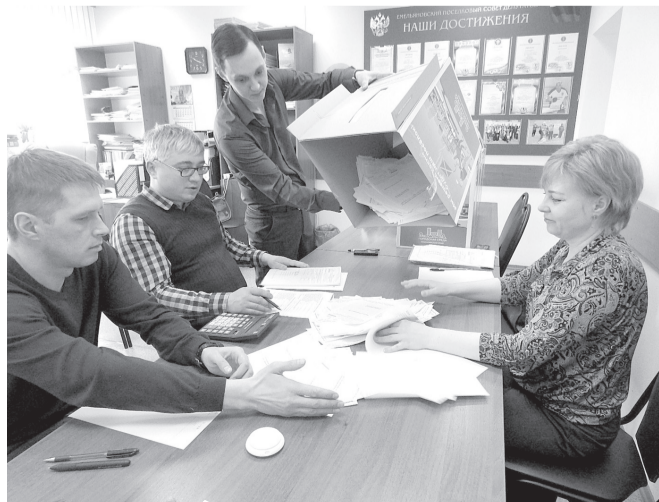
Подсчет голосов специалистами

Администрация Емельяновского района при содействии администрации поселка Емельяново