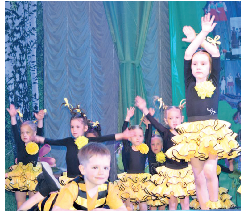
Юные артисты ДК

- IV Всероссийский фестиваль-конкурс «Вертикаль-личность»: народный хор «Сибирские самоцветы» (МДК) - лауреаты II степени.