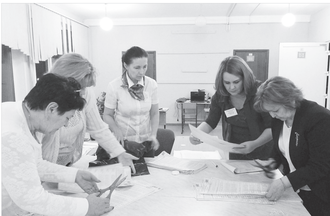
Идет подсчет голосов