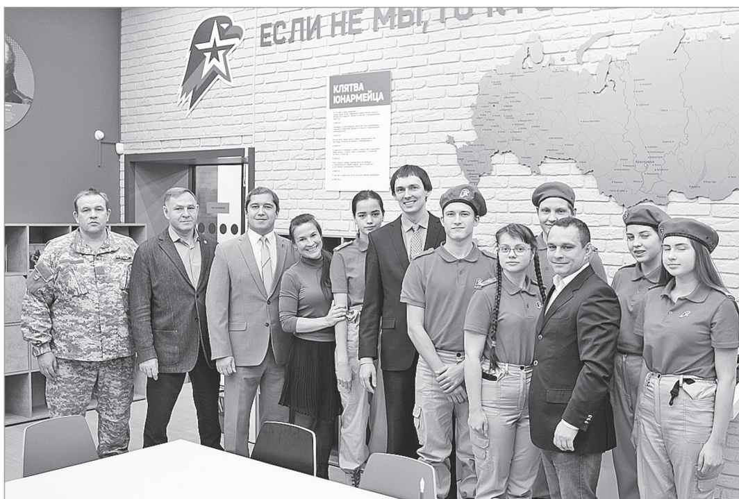
Открытие центра «Патриот» в Красноярске