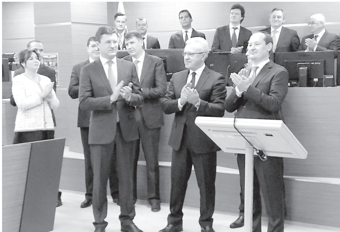
Новый энергообъект даже запустили дистанционно. Из Москвы