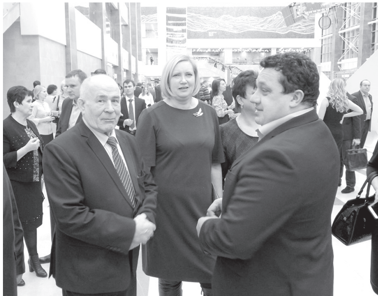
На церемонии открытия побывала делегация в составе главы Емельяновского района, его заместителей, представителей депутатского корпуса, глав сельсоветов

создают нацию. Концепция Енисейской Сибири как некий путь к пониманию того, кто такие сибиряки, положенная в основу дизайна аэропорта - целиком его идея. Не просто идея, а даже сам термин «Енисейская Сибирь» - огромный континент, где великая река неудержимо стремится к бескрай-