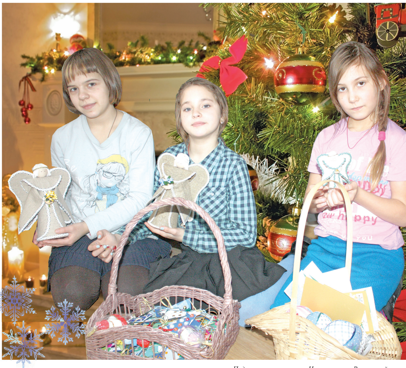
Подарки своими руками. На занятиях в Воскресной школе