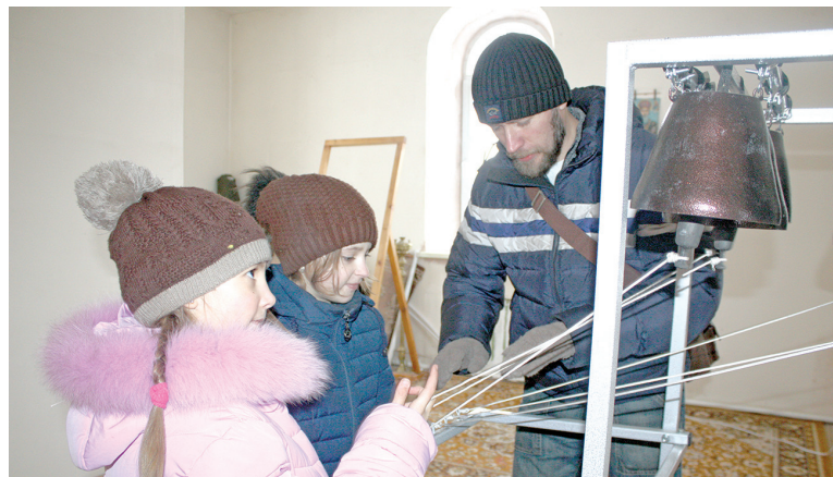
А пока юные звонари тренируются на учебной звоннице

В Красноярск прибыли колокола для звонницы церкви Параскевы Пятницы деревни Барабаново.